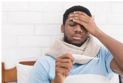
Fiebre de 100.4° o más